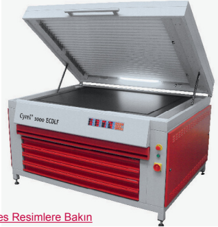
Hi-Res Resimlere Bakın