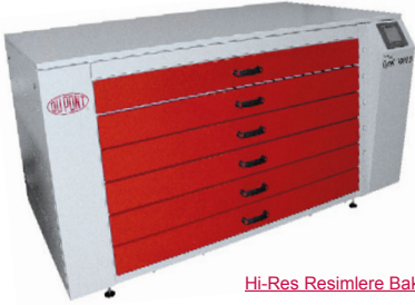
Hi-Res Resimlere Bakın