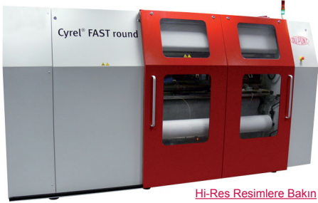
Hi-Res Resimlere Bakın