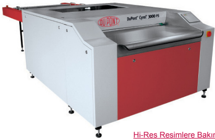
Hi-Res Resimlere Bakın