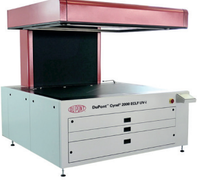
Yüksek çözünürlüklü resmi görüntüleyin

Geliştirilmiş UV çıkış kontrollü yüksek teknoloji pozlama ünitesi